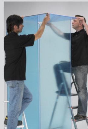
Montage de la structure