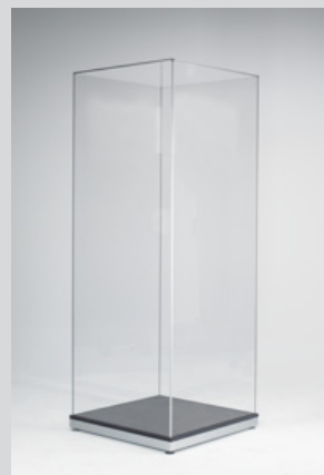
Fermeture et enlèvement des films de protection