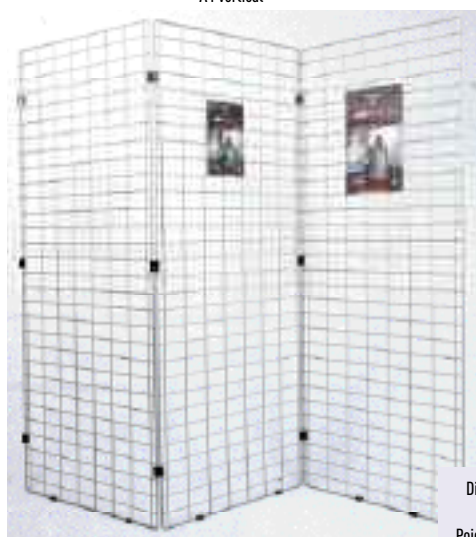
T1210001G Grille Ecofil gris alu