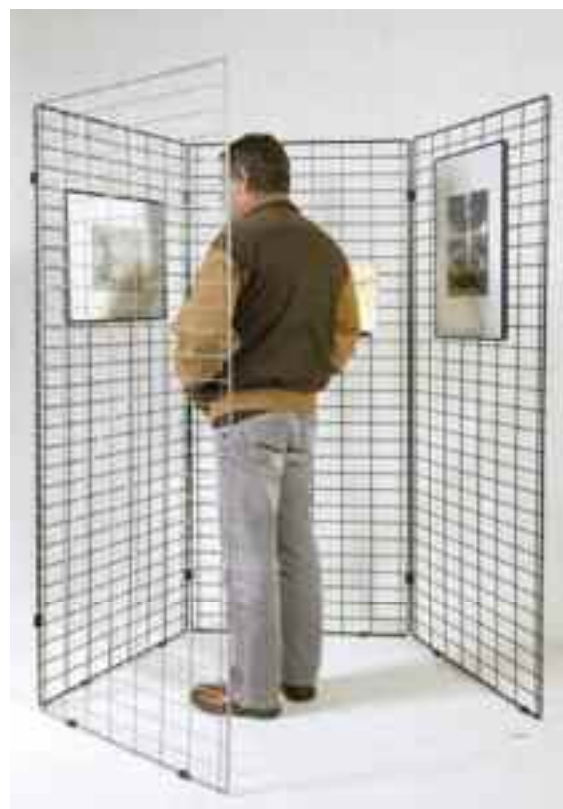
T1210001N Grille Ecofil noire