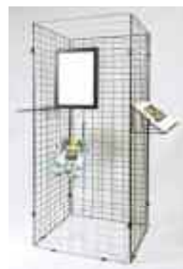
Exemple de configuration en carré

Dimensions hors tout H 180 x L 80 cm Poids des 3 grilles : 9 kg