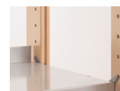
P6219002G Lot de 2 tablettes avec accessoires