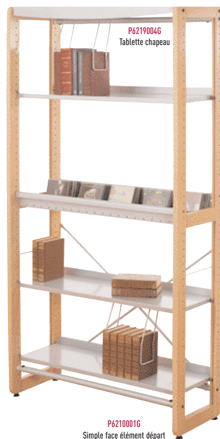
P6210001G Simple face élément départ