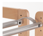
P6219001G Lot de 4 étriers de liaison