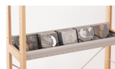
P6219007G Etagère-bac CD