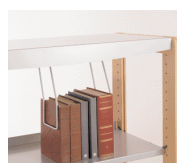
P6219008G Lot de 10 serre-livres