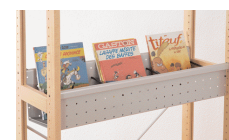
P6219006G Etagère-bac albums